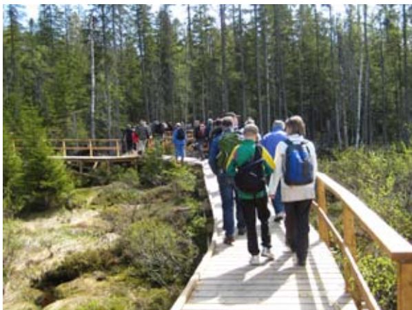
Tillgänglighetsanpassade stigar.

Målsättningen är att väl utförda och inbjudande entréer kommer att göra området välbesökt av både nationella och internationella besökare. Förhoppningen är även att lokala turismföretag skall kunna nyttja nationalparken i sina verksamheter.