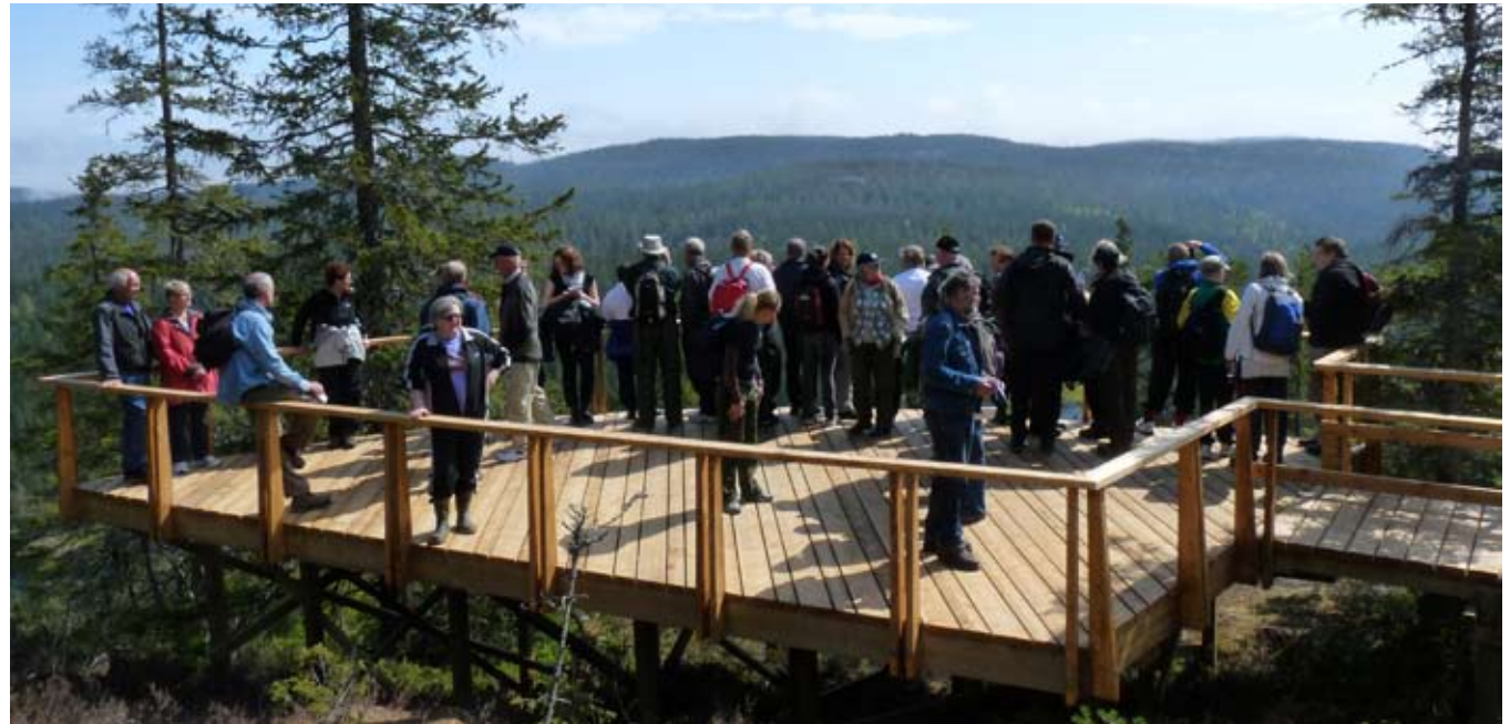
Utsiktsplats på Nylandsrutens.