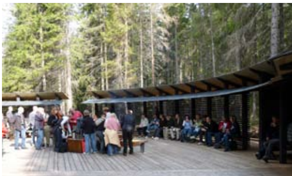
Västra Entrédäcket.

I projektet ingår även att ta fram en ny nationalparksfolder, nya informationsskyltar, en fotobok samt att uppföra en ny rast- och övernattningsstuga.